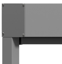
Z460 4K Solcell

Zip Screenen kan lackas i valfri kulör mot tillägg.